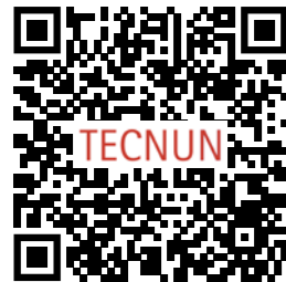
Admisión e información

Acceso directo desde el grado de Ingeniería de Tecnologías Industriales . Los estudiantes que hayan cursado Ingeniería Mecánica, Ingeniería Eléctrica, Ingeniería Electrónica Industrial e Ingeniería Química Industrial tendrán acceso al máster realizando unos Complementos de formación previos al comienzo del máster. Pueden cursarse de forma presencial o a distancia (online).