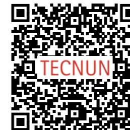
Admisión e información

Dirigido a graduados en cualquier especialidad de Ingeniería, Física o Matemáticas