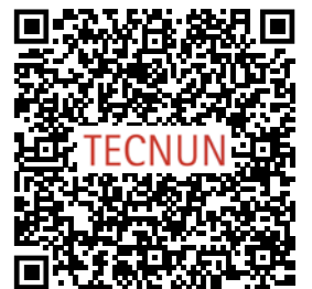
Doble Máster, MII + MINT

El Máster en Innovación Tecnológica puede combinarse con el Máster en Ingeniería Industrial, obteniendo un doble máster.