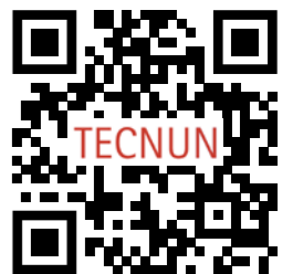
Doble Máster, MIT + MADI

El máster en Ingeniería de Telecomunicación puede combinarse con el Máster en Análisis de Datos en Ingeniería, obteniendo un doble máster.