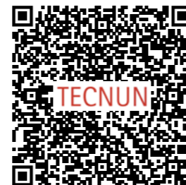
Doble Máster, MII + MADI

El Máster en Ingeniería Industrial puede combinarse con el Máster en Análisis de Datos en Ingeniería, obteniendo un doble máster.