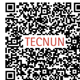
Doble Máster, MII + MINT

El Máster en Ingeniería Industrial puede combinarse con el Máster en Innovación Tecnológica, obteniendo un doble máster.